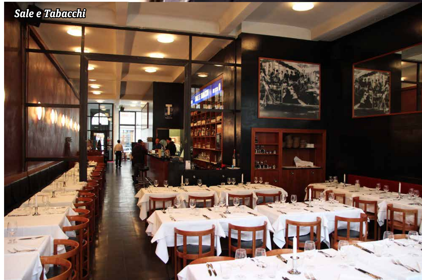
Sale e Tabacchi

Berlinale'de izlediğim Hollywood filmlerinden Mickey17, Zeitgeist'i iyi okumuştum. Filmin starı Robert Pattinson gibi görünüyordu. Kırmızı halıda yürürken genç kızlar çılgık çılgıydı. Fakat bana göre performans anlamında esas star Mark Ruffalo'ydu. Filmde yapay zekayla üretilmiş bir robot olan Robert Pattinson duygularına kulak vermeye çalışıyordu. Robotikliğe isyan